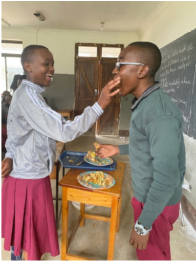
(Twee studenten voeren elkaar traditioneel taart. Ik trakteerde op taart tijdens mijn laatste les bij de Lords Hill Highschool)